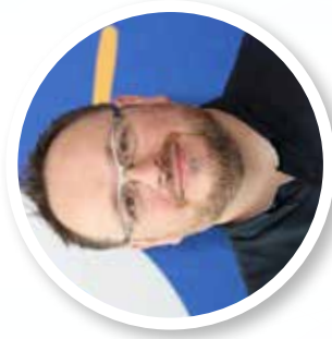
PRÉSIDENT FRÉDÉRIC FISCHBACH