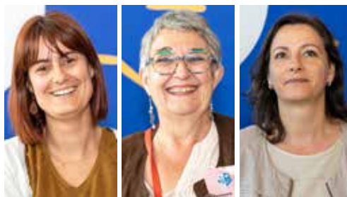
LE THÈME : REDONNONS DU SENS À NOS MÉTIERS.