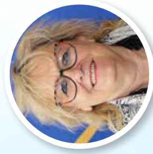
1 ÈRE VICE-PRÉSIDENTE PASCALE LICHTENAUER