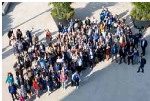
CONGRÈS DE LA FÉDÉRATION - MAI 2023 À METZ.